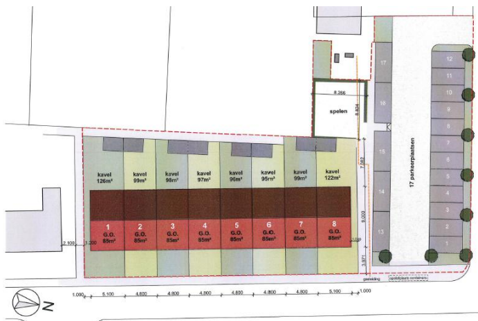
Situatietekening (onder voorbehoud)

De woningen zullen in een ononderbroken rij worden uitgevoerd met een voorgevel die in lijn ligt met de bestaande woningen. Het huidige parkeerterrein wordt opnieuw ingericht en biedt plaats aan 17 auto's. Achter de woningen wordt een ruimte gereserveerd voor een rustig en veilig gelegen speelruimte waar kinderen kunnen spelen en beschermd zijn van het verkeer. Hieronder zijn een impressie van de situatietekening en de woningen weergegeven. Beide schetsen zijn een impressie en kunnen op onderdelen nog aangepast worden. Er kunnen geen rechten aan worden ontleend.