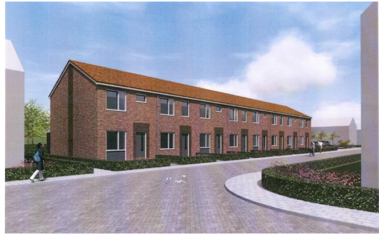
Impressie van de woningen