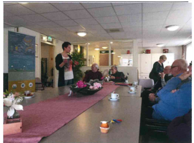
Presentatie Kerndebat in Heemzicht.

projectleider Omgevingsvisie Korendijk namens Spacevalue