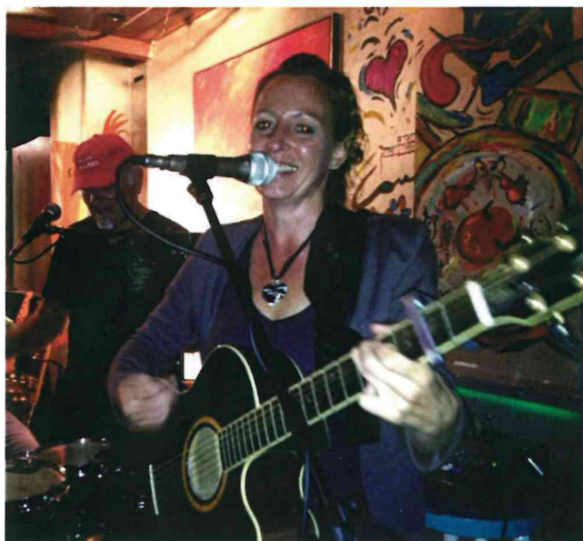
Pretty Good Girl

Natuurlijk zijn er ook verschillende muzikale optredens, o.a. het duo "Pretty Good Girl"